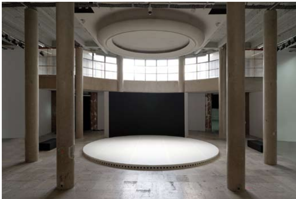
How Can We Know the Dancer from the Dance? , 2012. Courtesy Esther Schipper Gallery, Berlino, veduta della personale Anywhere, Anywhere, Out Of The World , Palais de Tokyo, Parigi, 2013. Foto Aurélien Mole

la versione di Huyghe del progetto No Ghost Just a Shell (1999-2003) in mostra al Centre Pompidou.