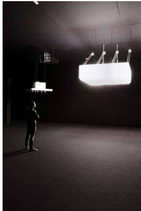
in basso: TV Channel , 2013, part., sullo schermo The Winter , 2007. Courtesy Pilar Corrias Gallery, Londra, veduta della personale Anywhere, Anywhere, Out Of The World , Palais de Tokyo, Parigi, 2013. Foto Aurélien Mole; a dx: Danny La Rue , 2013, part., veduta della personale Anywhere, Anywhere, Out Of The World , Palais de Tokyo, Parigi, 2013. Foto Aurélien Mole

Inoltre, nel video da cui trae il titolo la mostra, Anywhere Out of the World (2000), il personaggio manga Ann Lee prende vita: i suoi diritti d'autore, acquistati da Philippe Parreno e Pierre Huyghe a un'agenzia giapponese, sono stati messi a disposizione di una ventina di artisti, invitati a ricreare nuove possibilità di vita per il personaggio di finzione – da non perdere, a tal riguardo,